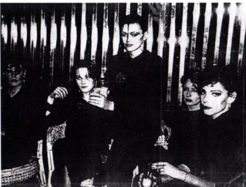
Malaria backstage im Studio54, Gudrun Gut stehend